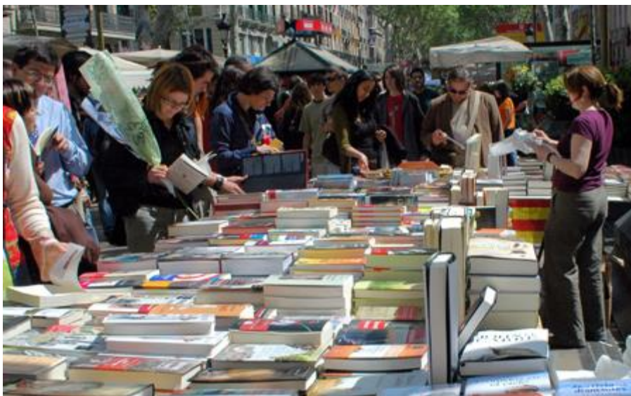
Parades de llibres a la Rambla de Catalunya el dia de Sant Jordi 2019

Segona circular: Barcelona, 24 de maig de 2019