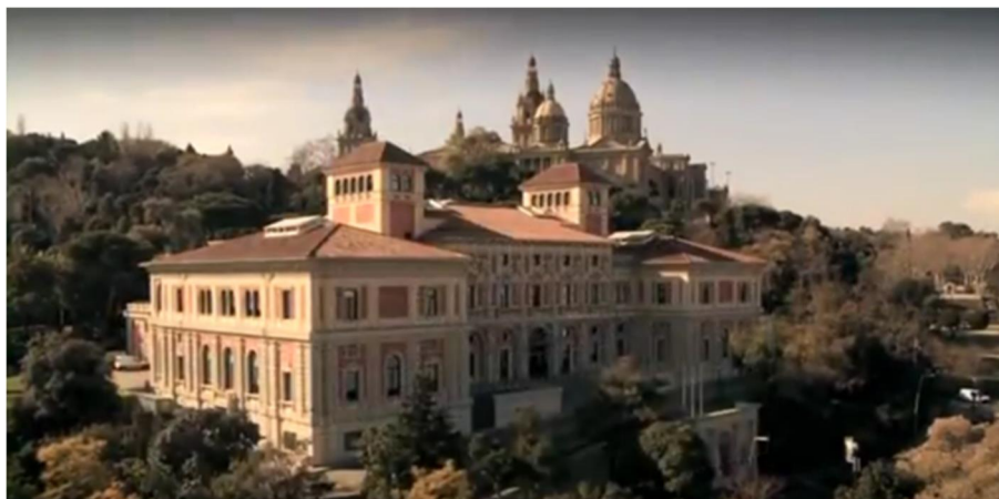
Seu de l'Institut Cartogràfic i Geològic de Catalunya a Barcelona